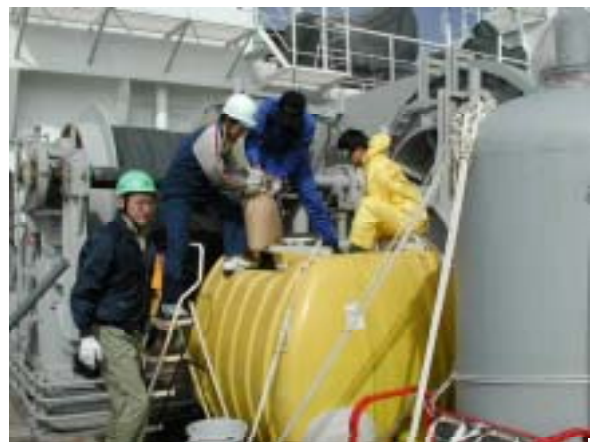
散布実験用硫酸鉄希釈溶液を作る